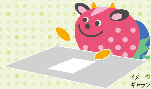
イメージキャラクター ギランベリー